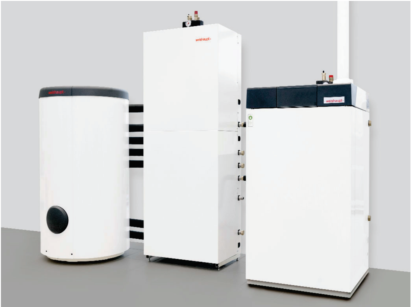
Installationsbeispiel mit Öl-Brennwertkessel